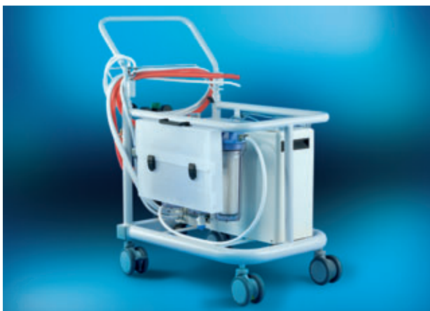
AquaUNO Porter mit Wasservorbehandlung: 100-µm-Filter, rückspülbar, 3×10"-Filter: 20 µm, Aktivkohle, 1-µm-Feinfilter